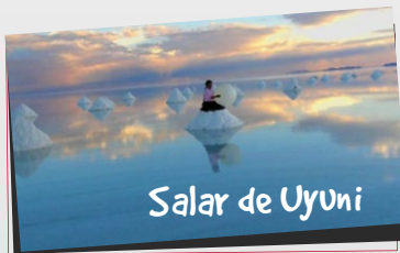
Salar de Uyuni