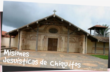
Misiones Jesuíticas de Chiquitos